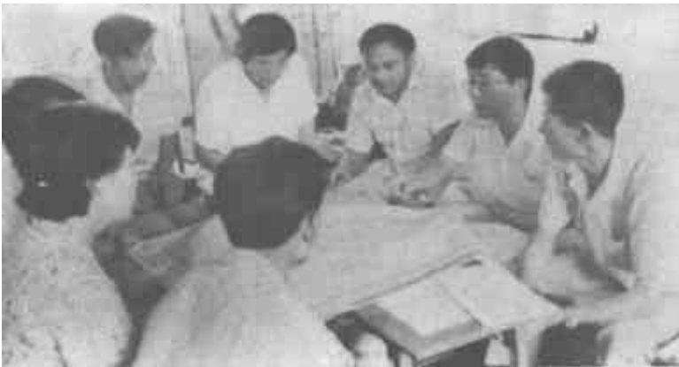
△为了巩固城市“社教”成果，把整改工作落到实处，东营区领导△与区直14个企业的负责人进行了扭亏增盈研讨，制定了切实可行的增盈措施。

——抓住两头，促使农村党建工作均衡发展。在农村开展“双十佳”活动，即每年评选出20个优秀党支部和20名优秀共产党员。采取县直部门和乡镇干部进村挂职、派驻农村党建工作队等形式，帮助后进村整顿班子，抓好两个文明建设。今年又抽调100名县直机关干部进驻20个后进村和10个先进村，从而促使一类班子上水平，二类班子上台阶，三类班子变面貌。 (栾庆恩)