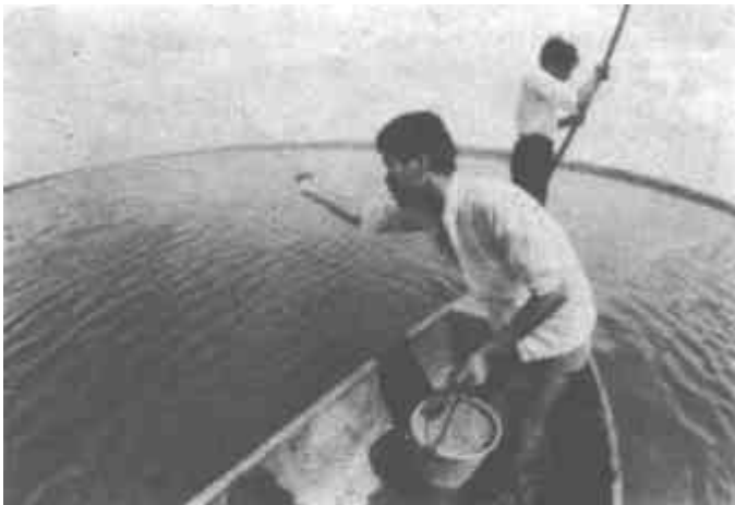
于往年。市外贸公司养殖场今年对虾长势好。图为养殖场人员进行定量投料。

变化之五：党规党法教育深入人心，党风廉政建设出现好势头。社教以来，市纪委把党规党法教育纳入城市“社教”范围，开创了我市党风廉政建设新局面。党规党法教育是建市以来搞得最广泛、最深入、最有成效的一次；查处县处级党员干部违纪案件、查处万元以上经济大案是建市以来最多的一次。